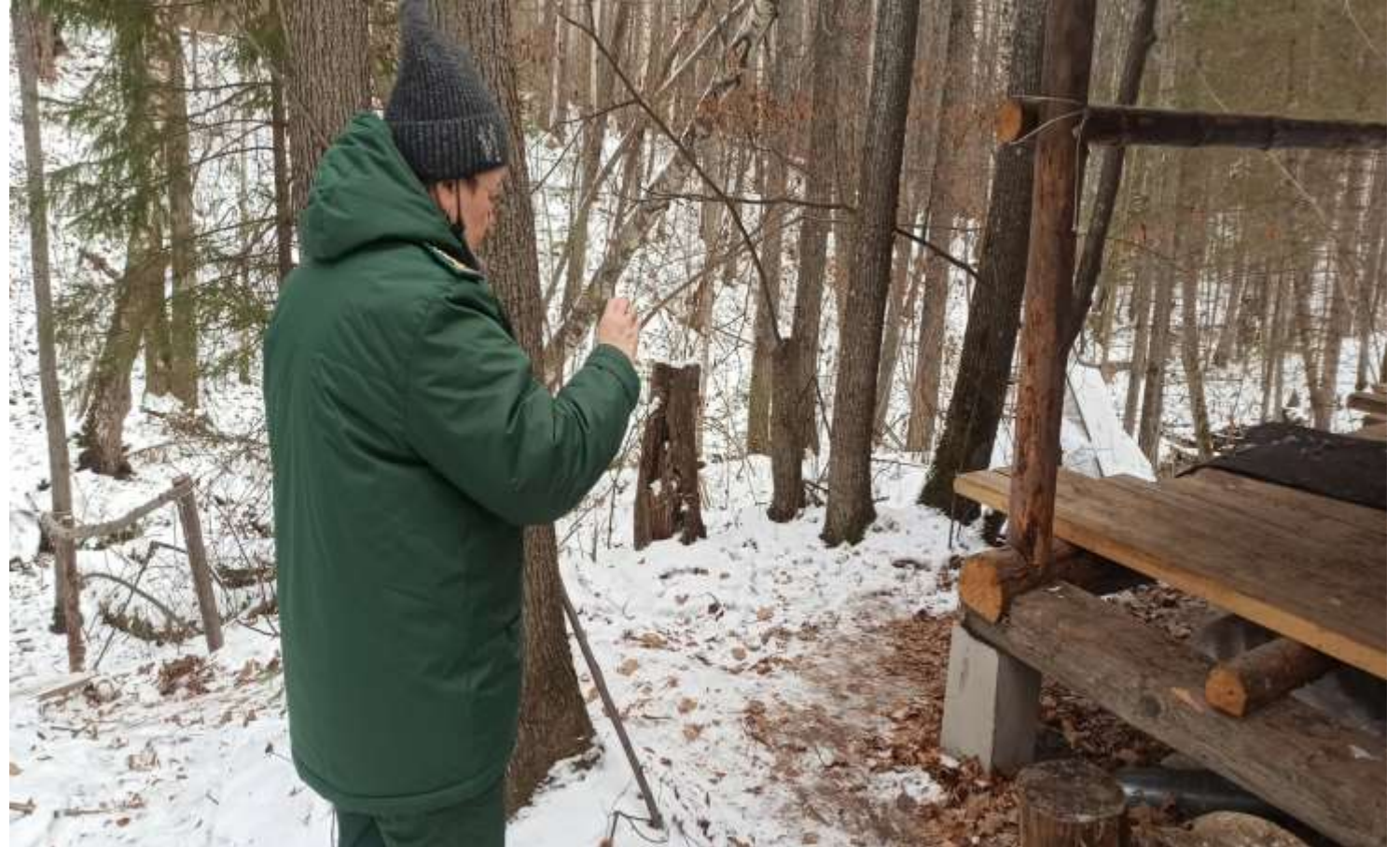
Осмотр места перекрытия почвенного покрова в результате незаконного строительства физическим лицом бани в охранной зоне ФГБУ «Национальный парк «Марий Чодра». Размер причиненного вреда почве составил 8,1 тыс.руб.