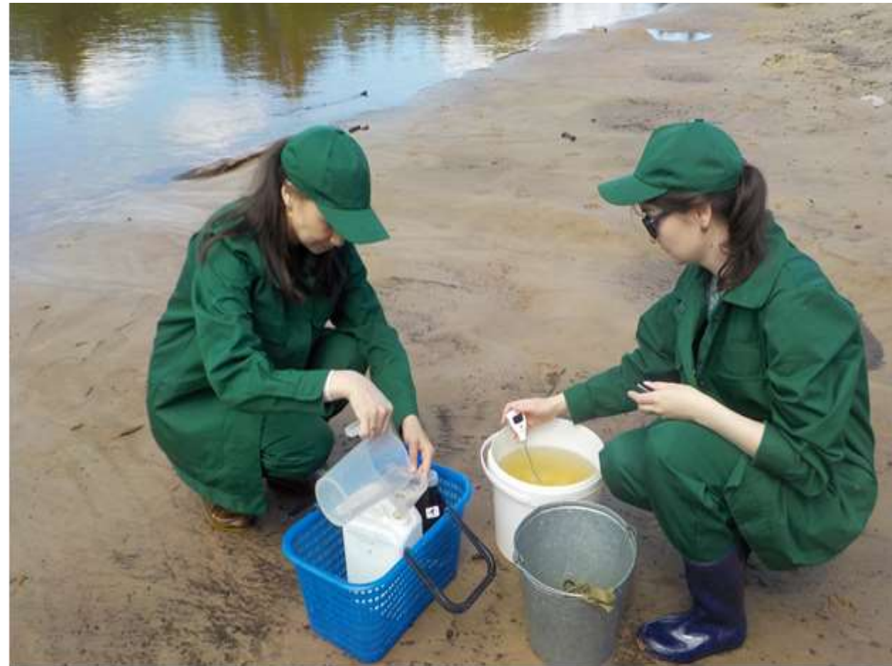
Отбор проб природных вод поверхностных водных объектов в рамках реализации Федерального проекта «Оздоровление Волги» нацпроекта «Экология»