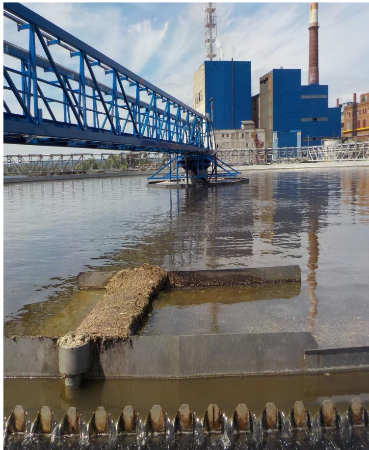
Очистные сооружения АО «МЦБК»