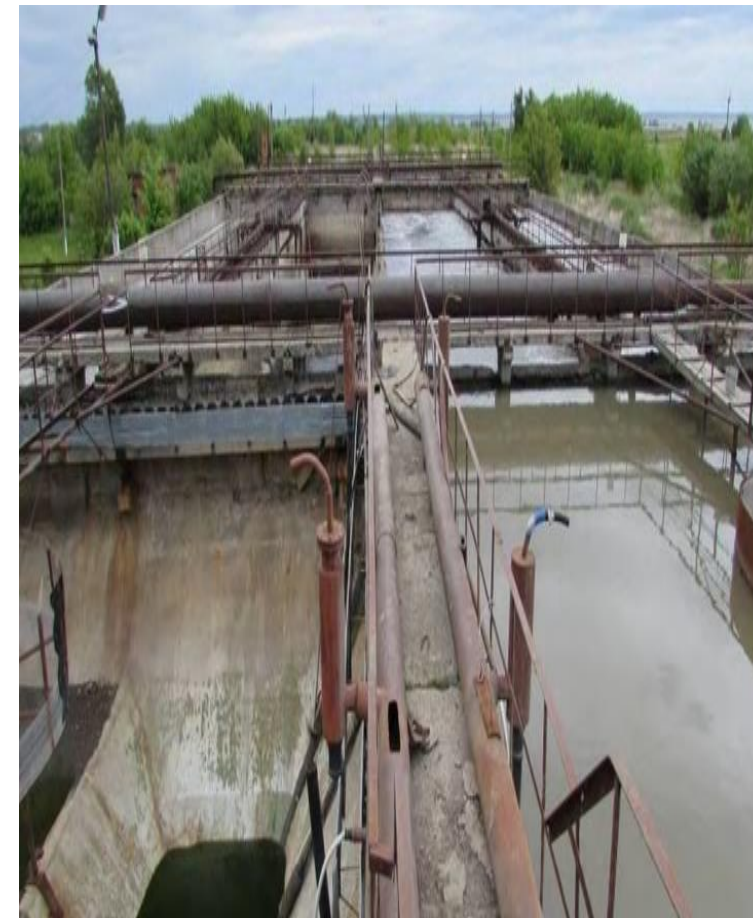
Очистные сооружения МУП «Водоканал»