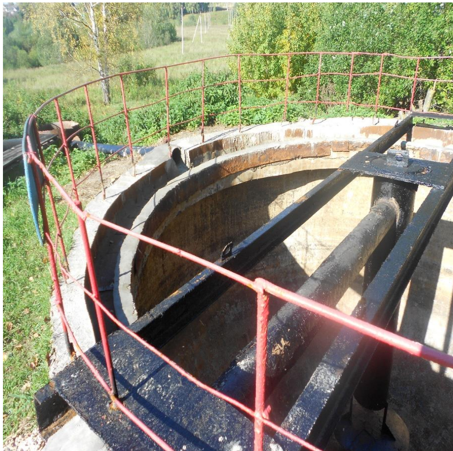
Очистные сооружения п. Новый Торъял