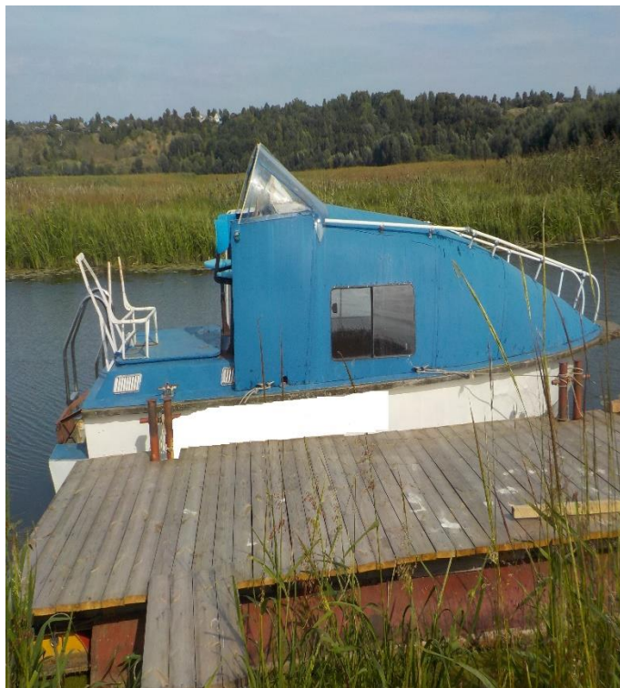
г. Волжск (занятие акватории р. Волга) – ст.7.6 КоАП РФ