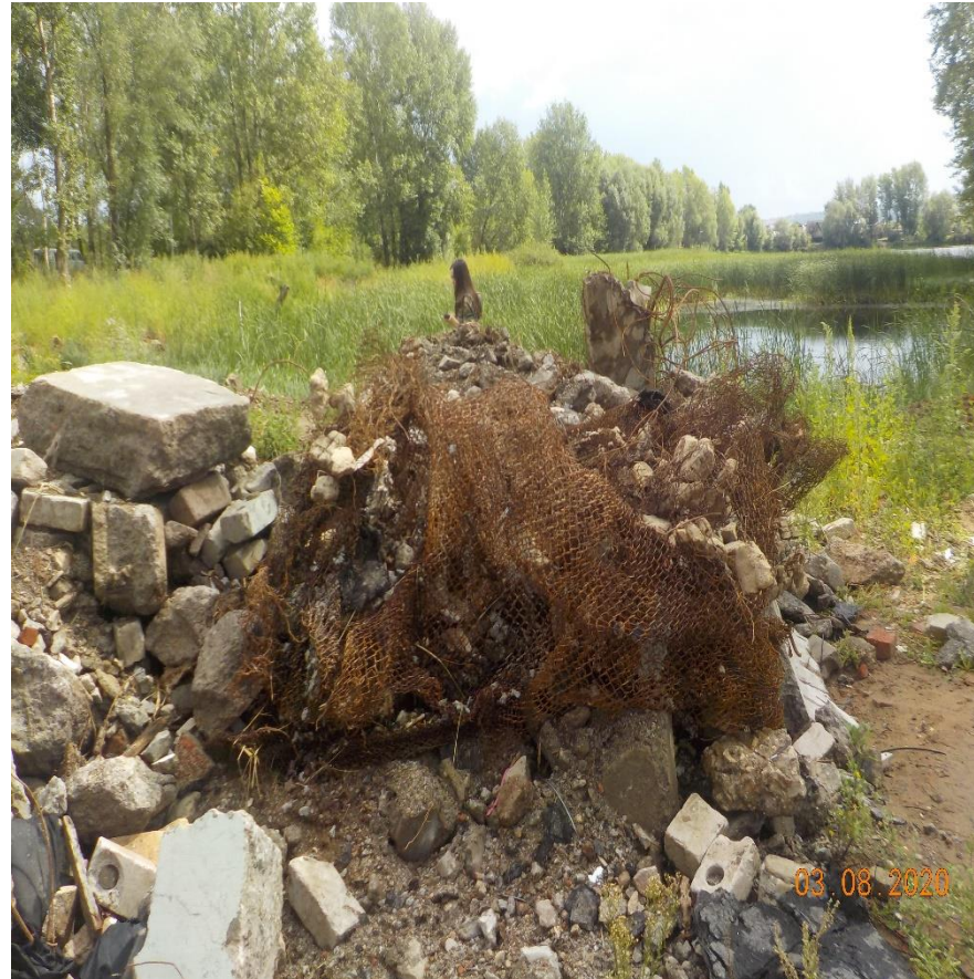
Нарушение режима использования земельных участков в водоохранной зоне – ч.2 ст.8.12 КоАП РФ