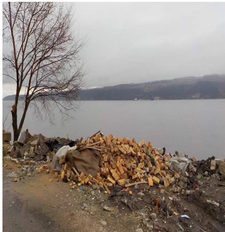
Захламление береговой полосы р. Волга – ч.4 ст.8.13 КоАП РФ