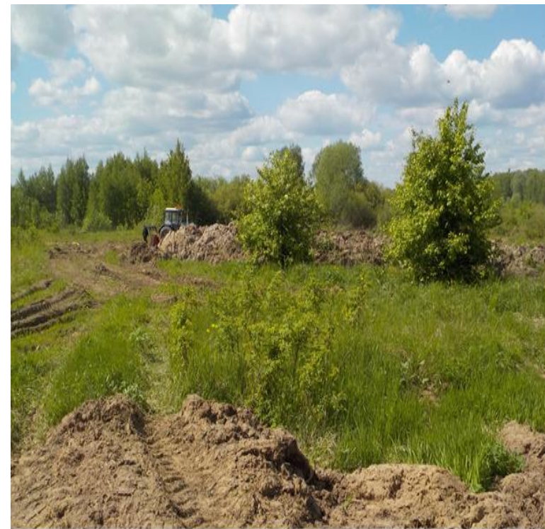
Движение транспорта в водоохранной зоне р. М.Кокшага - ч.1 ст.8.42 КоАП РФ