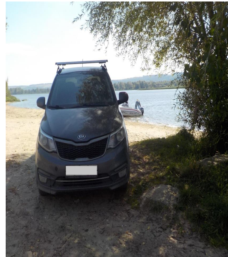
Стоянка транспорта в водоохранной зоне – ч.1 ст.8.42 КоАП РФ