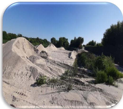
незаконная добыча песка в русле р. Дон