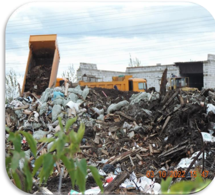
несанкционированная свалка строительных отходов